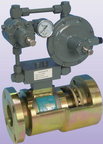
(2B ~ 4B)